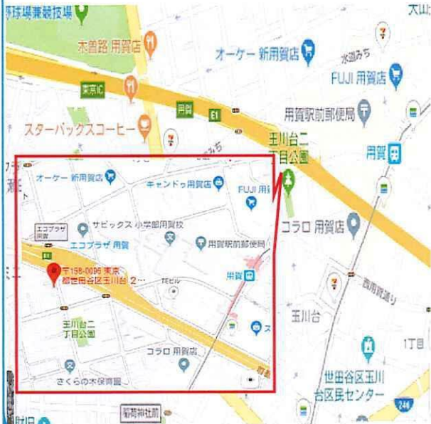
※ 図面と現況が異なる場合は、現況優先とします。