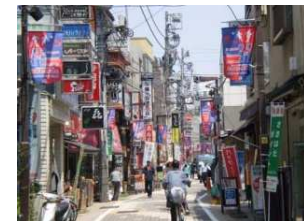
■ 西原商店街 (幡ヶ谷)