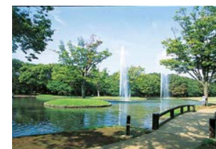
■ 代々木公園 (代々木八幡)