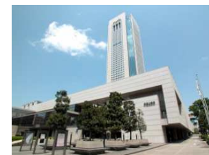
■ オペラシティ (初台)